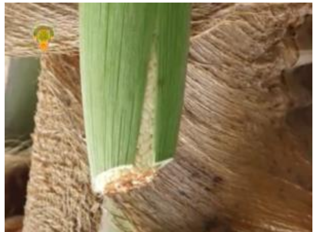
ปาดปลายวง

จากนั้น ให้เริ่มปาดปลายวง ที่มีกาบหุ้มอยู่ ให้ปาดทุกวัน จนกระทั่งมีน้ำตาลสดไหลออกมา แต่ถ้าน้ำตาลสดยังไม่ไหล ก็ให้ปาดวงออกไปประมาณ ๑ ใน ๓ เมื่อมีน้ำตาลไหลมากพอ ก็นำกระบอกรองน้ำตาล เพื่อรองน้ำตาล หลังจากนั้น จะต้องปาดวง และเปลี่ยนกระบอกรองตาลทุกวัน วันละ ๒ ครั้ง