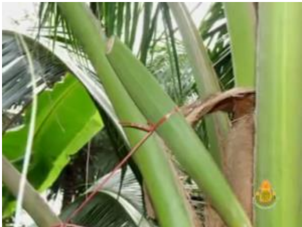
เหนียววงตาลให้โน้มลง

เมื่อมะพร้าวออกจั่น หรือดอกตูม ชาวสวนจะเริ่มเหนียว วง วงตาล (ที่ยังเป็นดอกตูม) มีลักษณะคล้ายวงข้าง มีกาบหุ้มอยู่ เมื่อดอกเริ่มแก่ กาบหุ้มจะแตกออก ดอกจะเริ่มเปลี่ยนจากดอกอ่อนสีเหลืองเป็นดอกแก่สีเขียว สาเหตุที่ต้องเหนียว วงตาล เนื่องจากปกติวงตาลจะขึ้นฟ้า ทำให้ไม่สามารถนำกระบอกรองน้ำตาลสดได้ จึงต้องเหนียววงให้โน้มลงล่าง ชาวสวนจะเริ่มเหนียววง ในตอนเย็น เนื่องจากตอนเช้าวง จะแข็งและหักง่าย ขณะที่ตอนเย็นวงตาลจะนิ่ม เนื่องจากได้รับความร้อนจากแสงแดดมาทั้งวัน การเหนียววงจะเริ่มทำตั้งแต่ดอกตูม โดยใช้มีดปาดบาง ๆ ที่โคนใต้ท้องวง แล้วใช้มือค่อย ๆ โนมลงมาช้า ๆ ไม่ควรโน้มมากเกินไปเพราะวงอาจหักได้ ทำให้น้ำตาลไม่ไหล ใช้เชือกผูก ให้ค่อนไปทางปลายวง เหนียวไว้กับทางมะพร้าวที่อยู่ต่ำลงไป เพื่อดึงให้วงโน้มปลายลงทีละน้อย จากนั้นจึงค่อย ๆ ผูกวันละน้อย หรือวันเว้นวัน จนกระทั่ง วงโน้มลงจนสามารถปาดได้