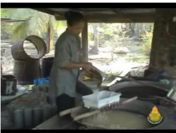
เทน้ำตาลใส่กระซอน

เคี้ยวจนน้ำตาลเริ่มเดือด ใช้กระซอนตักฟองออก ใช้กระวง ครอบกระทะไว้เพื่อป้องกันฟองล้น ออกมานอกกระทะ เคี้ยวต่อไปอีกประมาณ ๒๐ นาที น้ำตาลจะเริ่มงวดลง จึงนำกระวงออก