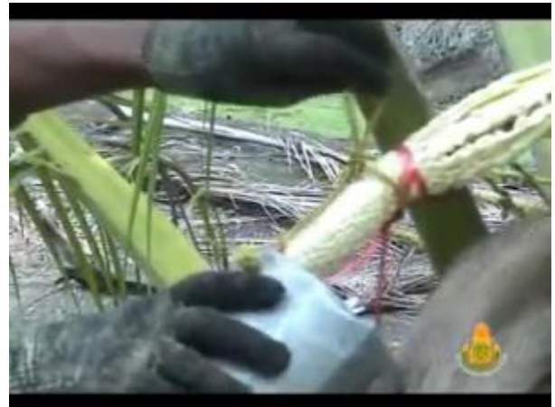
กระบอกรองจั่นที่ปาดแล้ว

ถ้าวงไหนมีน้ำตาลไหลออกมาก ให้ปาดบาง ๆ เพื่อให้ปาดได้นาน ๆ และปาดได้ถึงโคนวง แต่ถ้าวงไหนมีน้ำตาลออกน้อย ก็ต้องปาดหนา แต่ก็จะทำให้วงหมดเร็วขึ้น เมื่อวงตาลเริ่มเปลี่ยนจากสีเขียว เป็นสีเขี้ยว ให้ลอกเอากาบออก แล้ว ใช้เชือกผูกวงตาล คล้ายกับผูกข้าวต้มมัด เพื่อให้วงมัดเป็นกลุ่ม และสามารถปาดวงต่อไปได้ตามปกติ ปกติจะสามารถปาดวงตาล จนถึงโคน วงจึงจะหยุดให้น้ำตาลสด ซึ่งก็ต้องเริ่มปาดวงใหม่ต่อไป