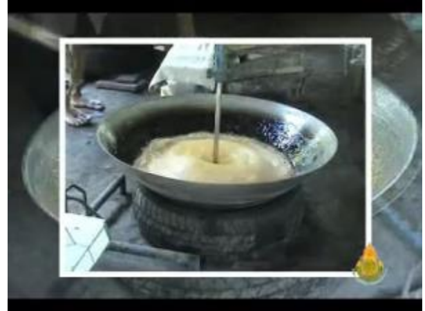
กระทุ้งเพื่อให้น้ำตาลแห้ง