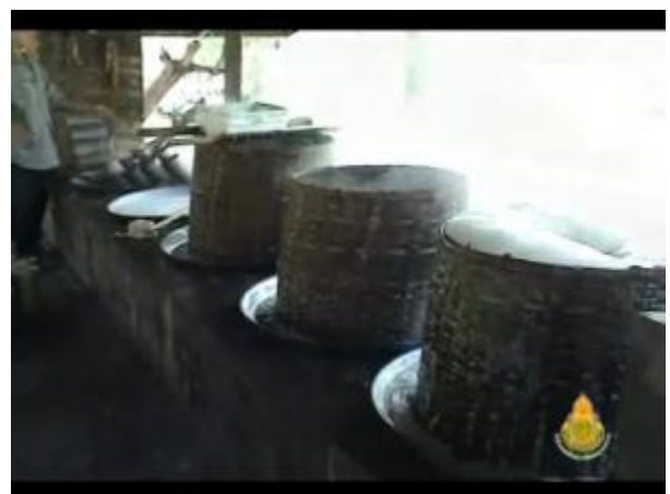
ครอบเพื่อป้องกันฟองล้นกระทะ