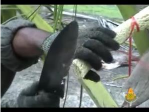
ใช้มีดปาดจั่นบางๆ

การขึ้นตาลจะแบ่งเป็น ๒ ช่วงคือ ช่วงเช้า ตั้งแต่เวลา ๕.๐๐ ถึง ๑๒.๐๐ เรียกว่าตาลเช้า และช่วงบ่าย ตั้งแต่เวลา ๑๔.๐๐ ถึง ๒๐.๐๐ เรียกว่าตาลบ่าย การขึ้นตาล ทำได้โดยนำกระบอกลูกที่เตรียมมาให้เท่ากับจำนวนกระบอกลูกที่รองไว้เดิม ต่อต้น จากนั้นจึงป็นพะอง ขึ้นไปจนถึงวงตาล ปลดกระบอกลูกเดิมที่รองน้ำตาลไว้ จากนั้นใช้มีดปาดตาลปาดที่วงตาลบาง ๆ นำกระบอกลูกใหม่มาเปลี่ยนเพื่อรองน้ำตาลแทนกระบอกลูกเดิม ทำให้ครบทุกต้น